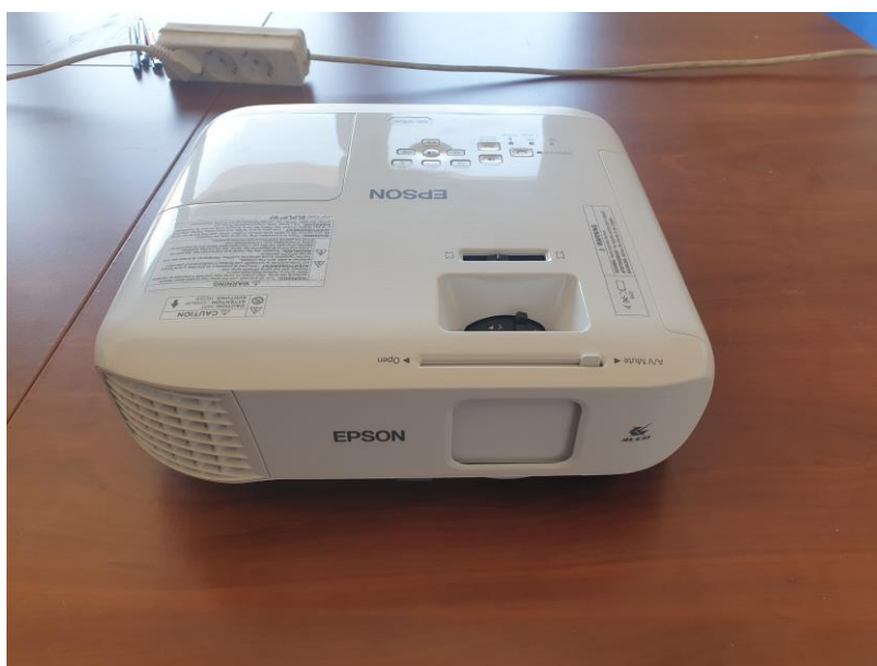
1. és 2. ábra: a pályázati forrásból megvalósult beszerzés (EPSON EB-992F projektor)